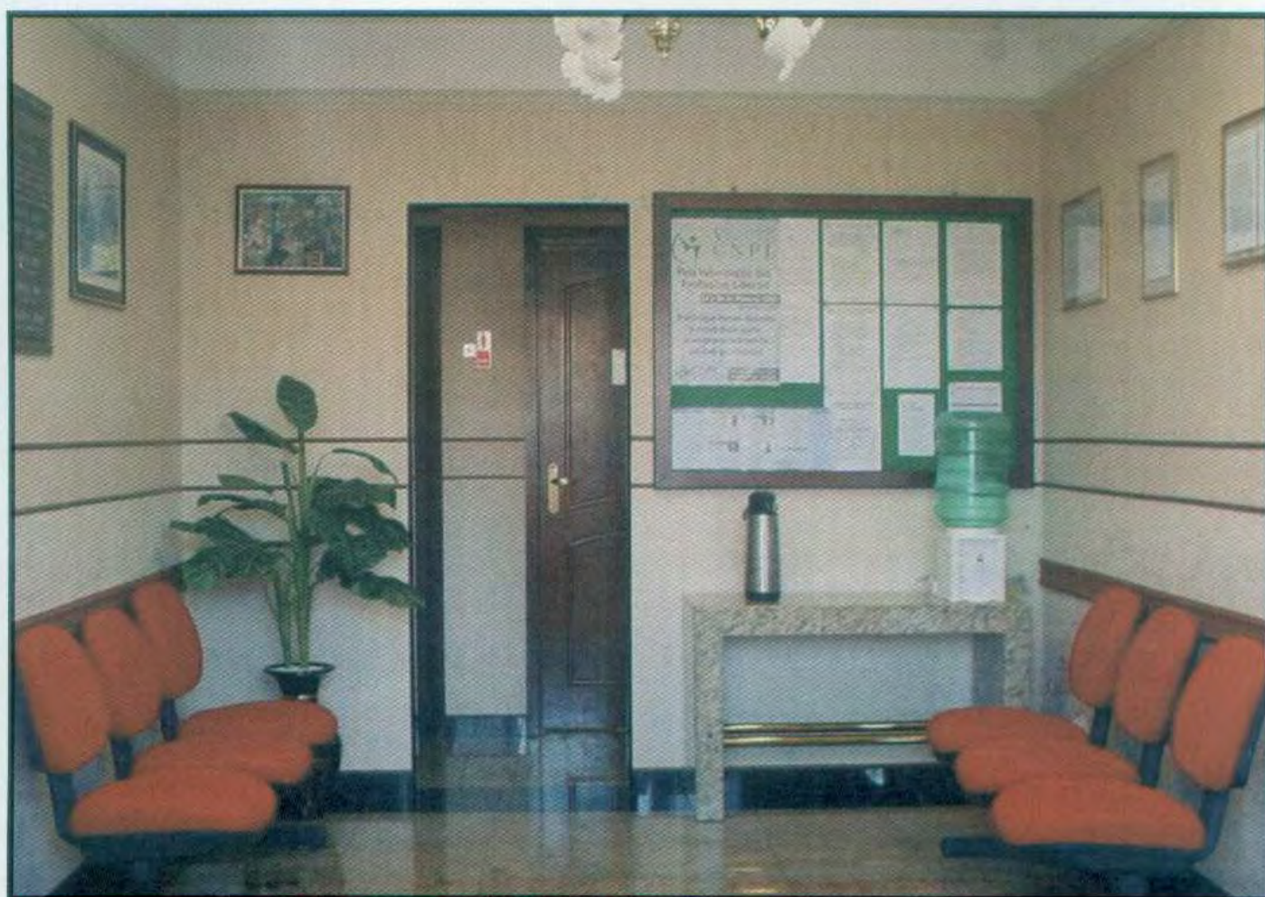
SINTRACARP - Recepção